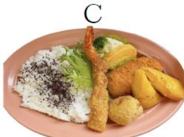
ミックスフライ弁当